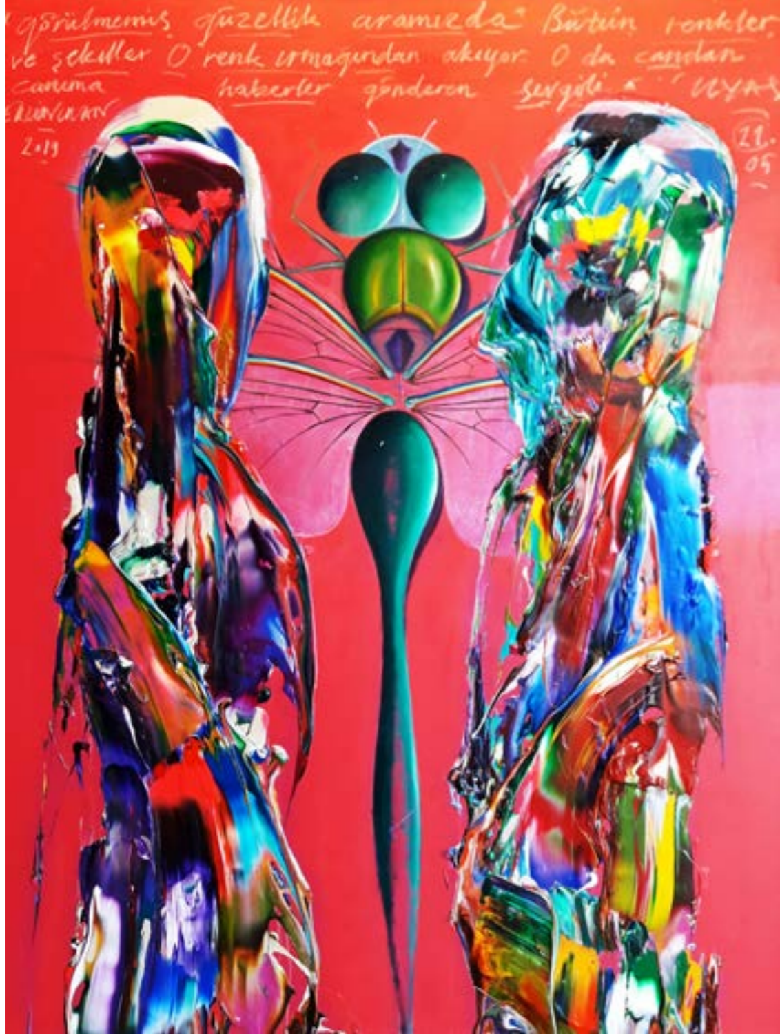
Ergin İnan, 2019 Tuval üzerine karışık teknik 180 x 140 cm