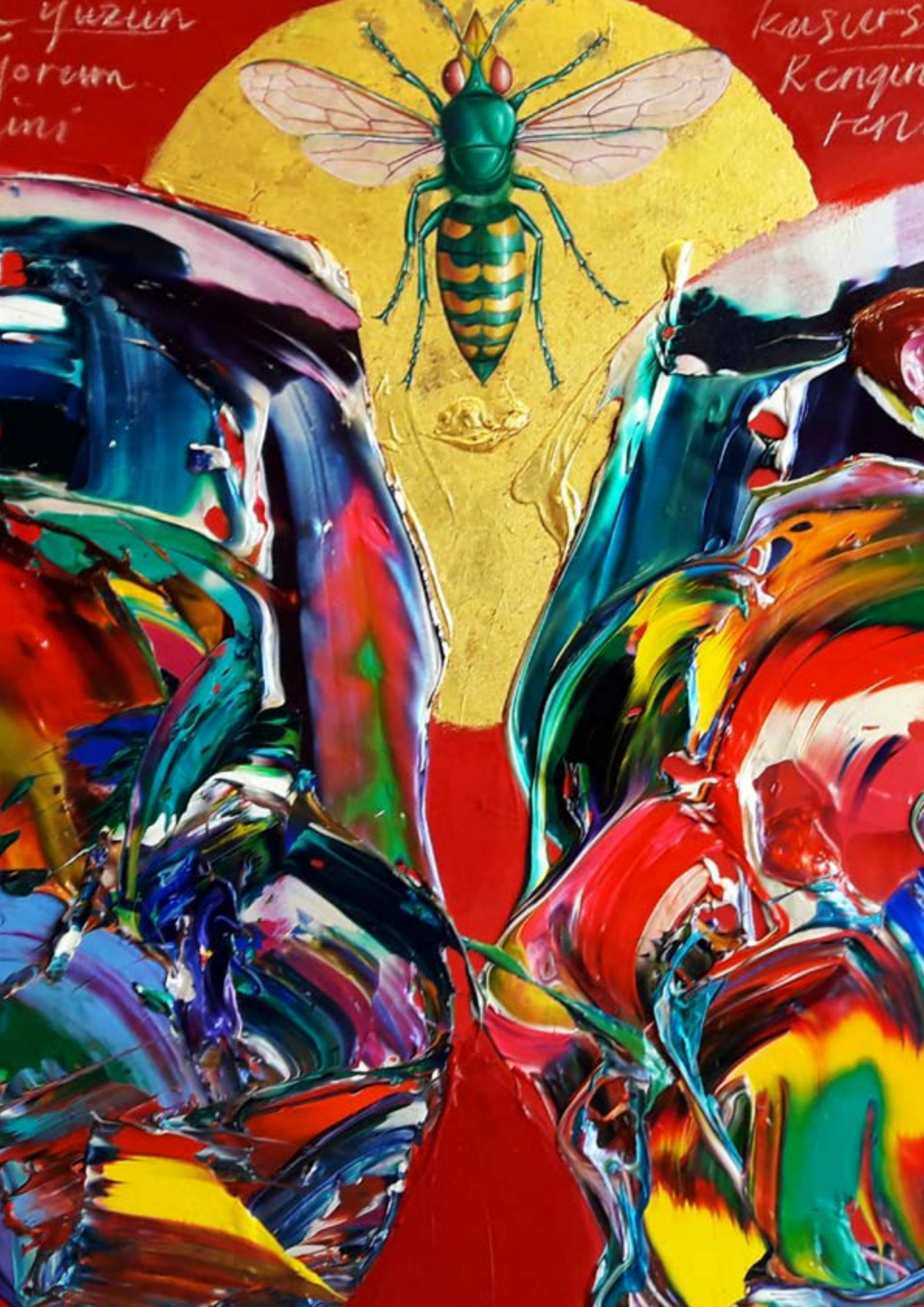
Ergin Inan, 2019 Tuval üzerine karışık teknik 100 x 150 cm